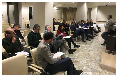
◀ Un momento della riunione d'insediamento dei Tavoli

nenti alla professione, alla luce dello sviluppo della tecnica, delle evoluzioni tecnologiche, dell'entrata in vigore di nuove leggi e/o regolamenti, dell'emanazione di norme e/o circolari tecniche e, in ogni caso, del verificarsi di qualsiasi evento per il quale sia ritenuto opportuno intraprendere un'attività di studio e/o di approfondimento, nell'interesse generale della categoria e della collettività;